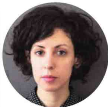
שניידר. "דימוי האדם האחד בחלל קטן"

שניידר בת ה־33 חיה ארבע שנים בניו יורק. היא בוגרת החוג לתקשורת חזונית בשנקר, ולניו יורק הגיעה לטובת לימודים בבית הספר Tisch של NYU. במקביל לעבודתה כאמנית ומעצבת עצימאית, היא בעלת סטודיו פרטי לעיצוב אינטראקציה. "עוד בתקופת הלימודים בשנקר הרגשתי שאני מנסה לפרוץ את השימוש בכלים המוכרים ולהגיע לאס־תמיקות חדשות", היא מספרת. "אני כל הזמן ממשיכה לחקור טכנולוגיות חדשות, וכל פרויקט מציב בפניי אתגר אחר". הטכניקה בה משתמשת שניידר בסדרת עבודות אלה היא מורכבת