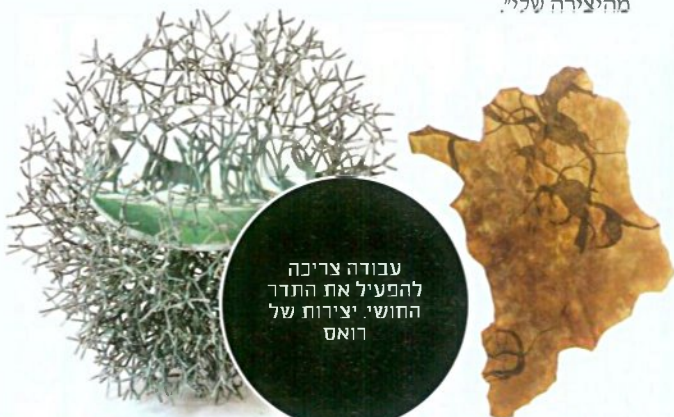
עבודה צריכה להפעיל את התדר החושי. יצירות של רואס

"החלום הוא לזכות להכרה ולהיות מסוגל להתפרנס במאה אחוז מהיצירה שלי".